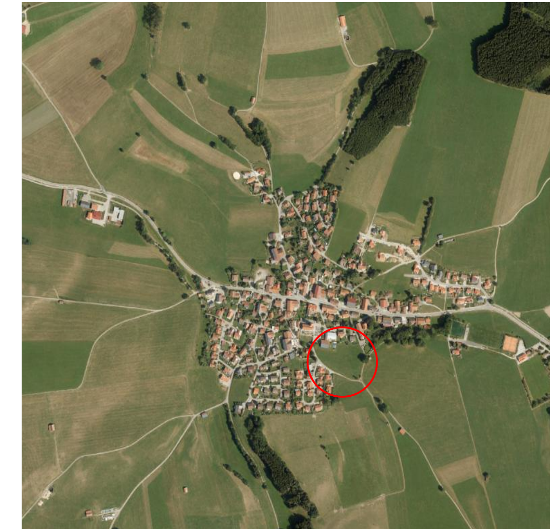
Ausschnitt Luftbild unmaßstäblich

Gefertigt am: 28.09.2023 Geändert: 15.02.2024 Endfassung: 27.08.2024